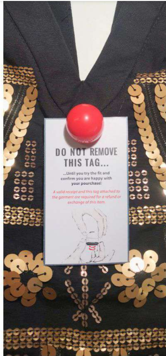
El imposible volver a poner en la prenda una R-Turn Tag. Checkpoint Systems

Checkpoint Systems comercializa tanto una ' Shark tag ' un pin que se engancha en la parte delantera de las prendas y que solo puede ser extraído cortándolo con unas tijeras, como la etiqueta R-Turn . Ambas imposibles de ocultar y que no se pueden volver a poner de ningún modo.