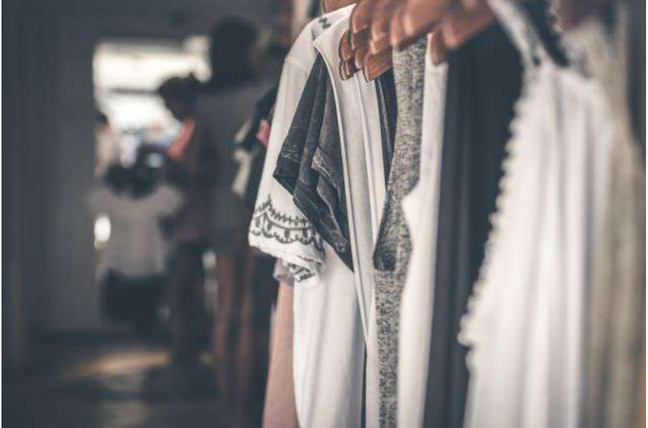
Los eventos sociales incrementan la práctica de las devoluciones usadas.

avituallado. Las bodas, las entrevistas de trabajo y los eventos sociales como graduaciones o despedidas son otros de los momentos en los que se recurre a esta picaresca.