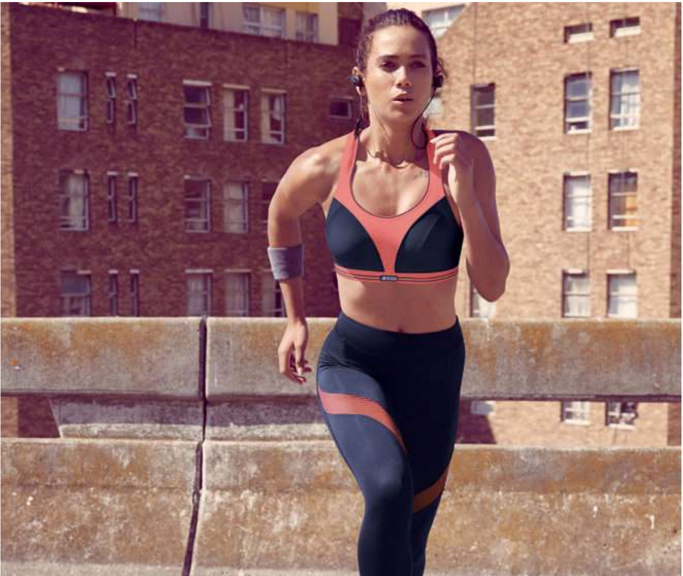
La marca Shock Absorber está especializada en sujetadores deportivos para deportes de alto impacto.