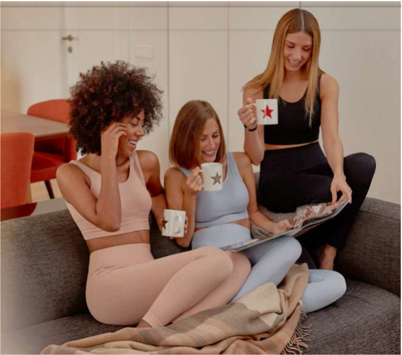
Los bonitos tonos pastel y la adaptación a la silueta es la clave de los diseños de Born Living Yoga.