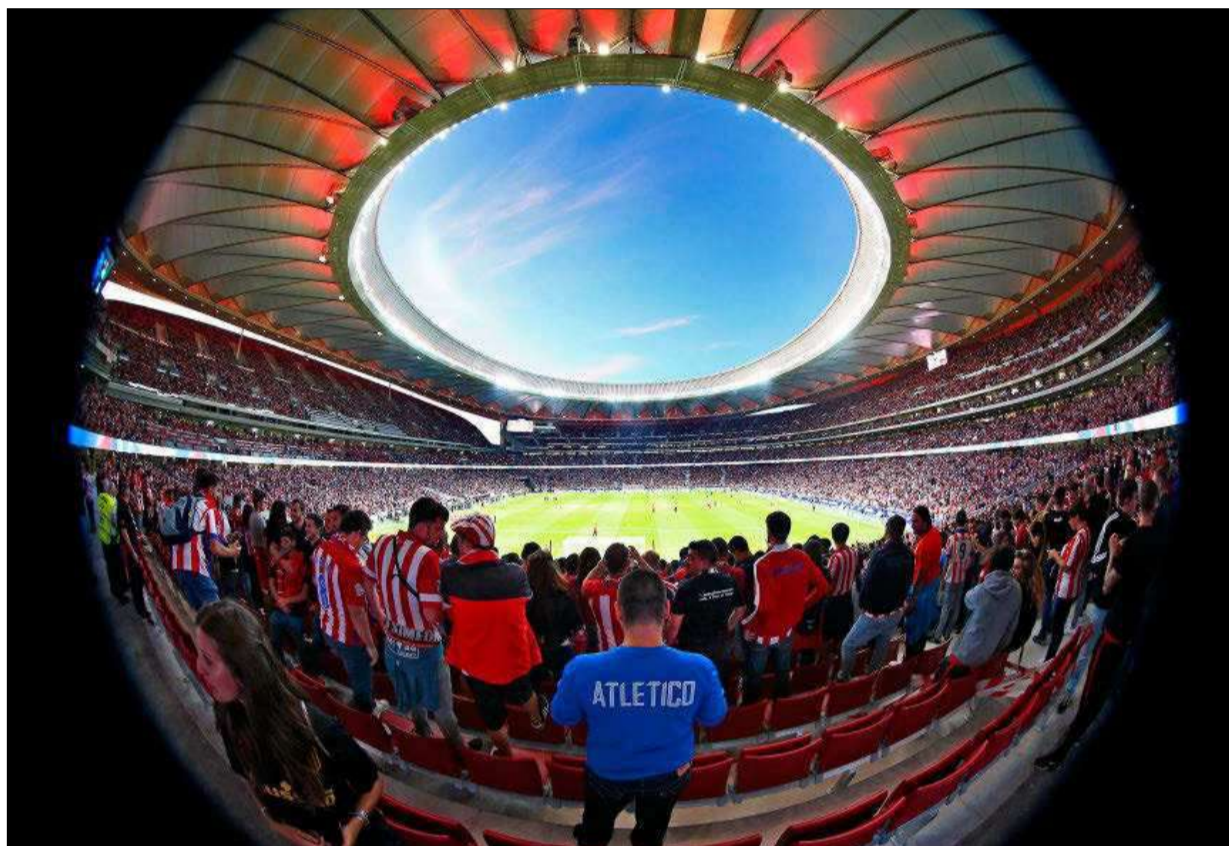
PÁGINA 48

El Atlético de Madrid comenzó un nuevo capítulo en su historia con la inauguración del estadio Wanda Metropolitano, a la que asistió el Rey Felipe VI. Más de 68.000 aficionados llenaron las gradas de la nueva casa rojiblanca y formaron un espectacular mosaico. El balón llegó desde el cielo gracias a la patrulla Águila. Griezmann marcó el primer gol del estadio en la victoria del Atlético 1-0 al Málaga.